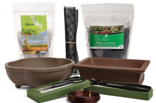
Senior apprentice collection