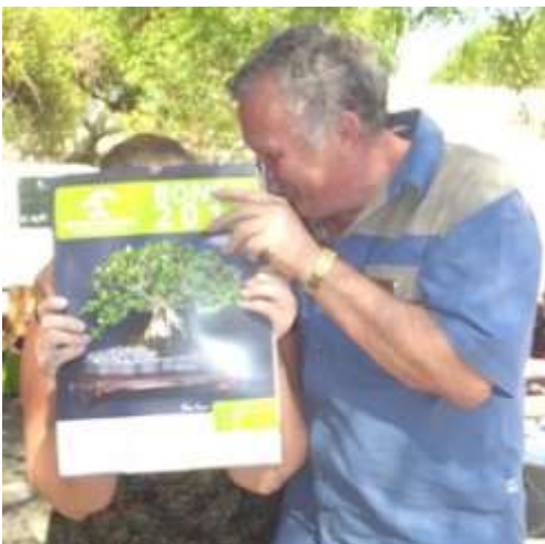
Ag asseblief een ou fototjie.....