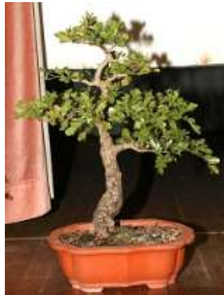
Links: Louis het hierdie Huilboerboon ( Schotia brachepetala ) 10 jaar gelede by 'n kwekery in 'n swart sakkie gekoop.