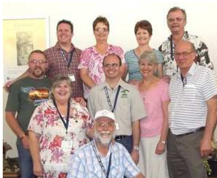
Below: Some of the Pretoria Kai members who attended the convention.