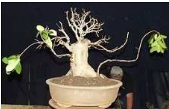
Right and top: Rob styled this Silver Oak.