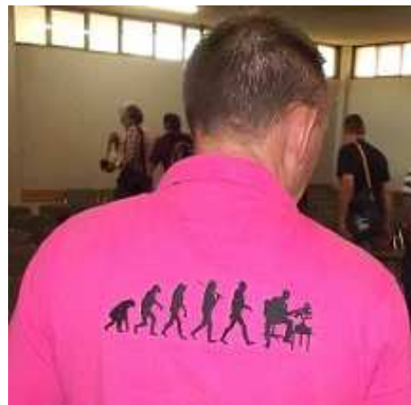
Below: Some T-shirts observed at the convention.