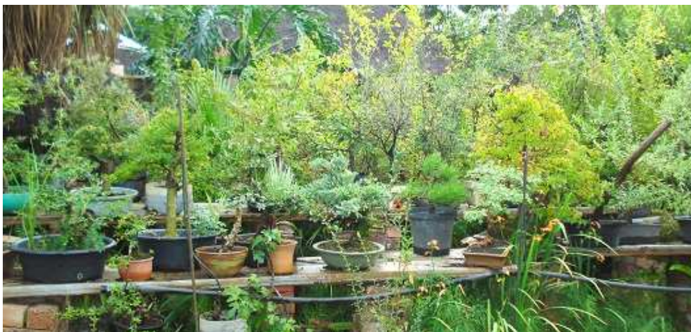
As beginner, do not start with too many trees.